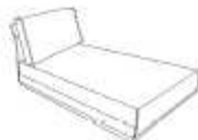
Chaise longue sans acc 100x92x173