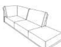
Lounge d 90x92x173