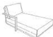
Chaise longue acc bois g 107x92x173