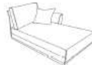
Chaise longue acc d 126x92x173