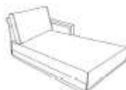
Chaise longue acc bois d 107x92x173