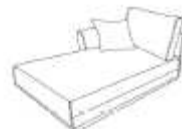
Chaise longue acc g 126x92x173