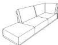
Lounge G 100x92x173